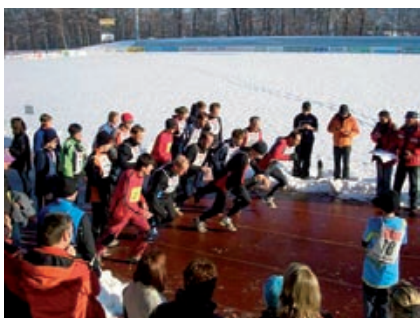
Statt mit dem Ski wurde Cross gelaufen – allerdings im Schnee.